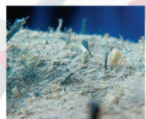
Fractura de fibrocemento