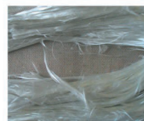
Detalle fibra Amianto

- Amianto no friable : Las fibras de asbesto (amianto) están mezcladas con un cemento o cola (fibrocemento), muy usado por sus cualidades en el sector de la construcción